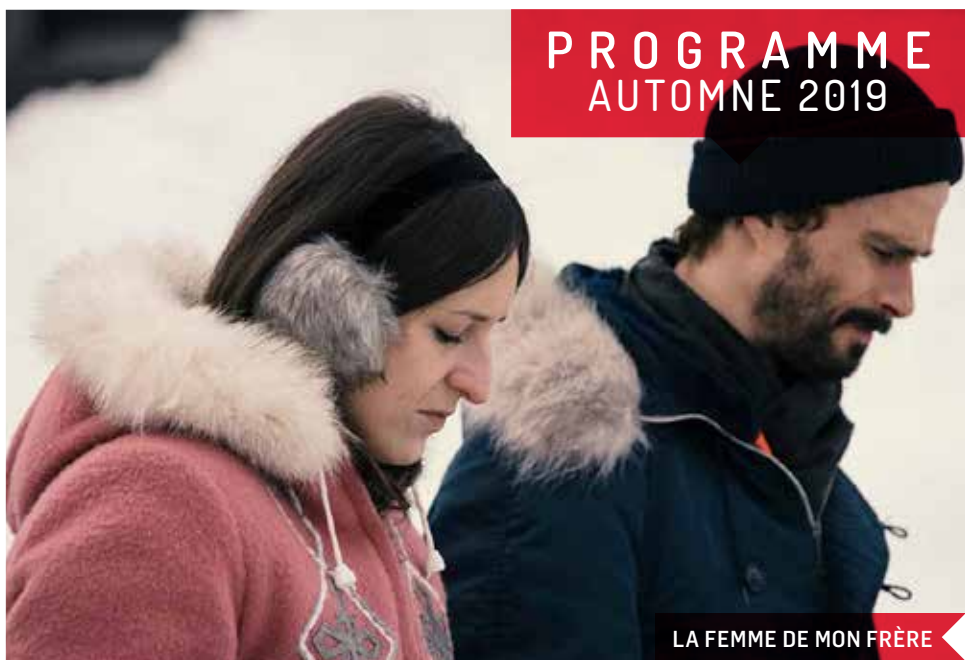
LA FEMME DE MON FRÈRE