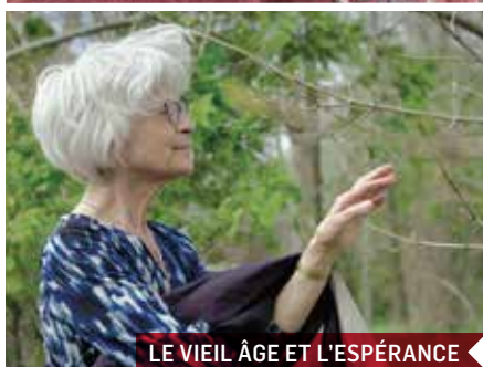
LE VIEIL ÂGE ET L'ESPÉRANCE